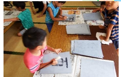
夏休みの宿題を見守ってもらっています♪