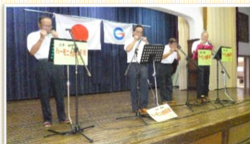
二胡の会 大正琴 ハーモニカ 銭太鼓 3B 教室