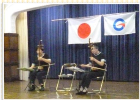
一緒にお祝いをしていただきました