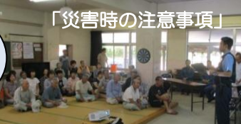
「災害時の注意事項」