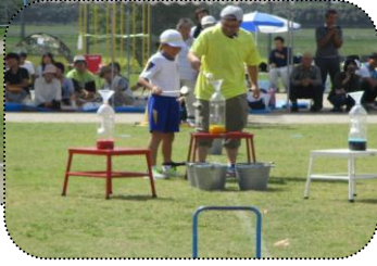
5.6年親子競技「全全全部」