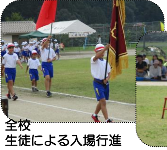
全校生徒による入場行進