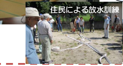
住民による放水訓練