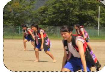
全校女子「ソーラン節」