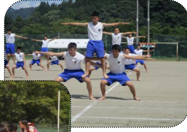
全校男子「組み体操」

100m競争に始まり色別選手リレーまで行われましたが、全校女子の「ソーラン節」と全校男子の「組立体操」では全員見事なチームプレーで拍手がわきました。