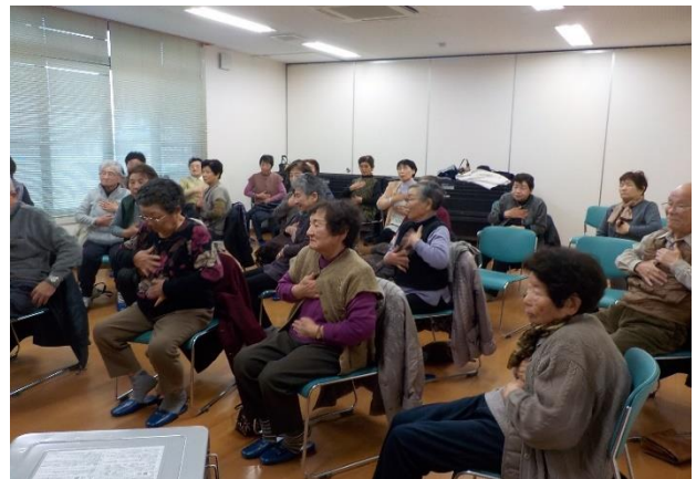
昨年好評で是非今年もとの声が多かった