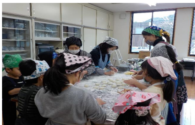
めずらしい体験に児童たちも興奮気味