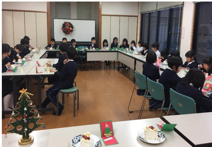
最後に各自で作ったケーキを頂きました