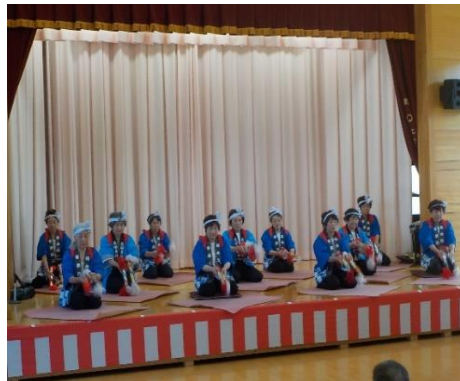
銭太鼓愛好会の皆さん