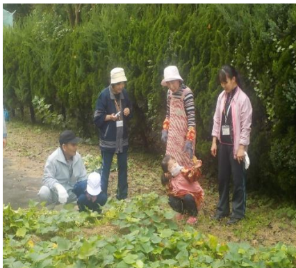
大きいお芋出てくるかな