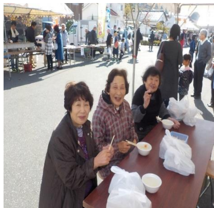
郷土の偉人青木秀清を偲んで芋粥