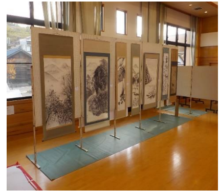
墨絵は渡津を代表する芸術