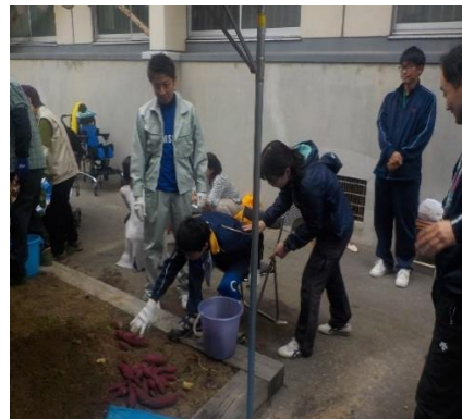
今年は豊作でした