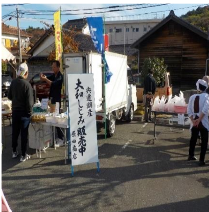
新規の大和シジミの販売