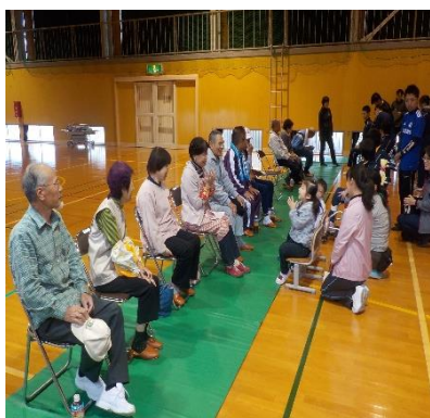
まずは生徒さんにご対面

10月17日(火) 毎年恒例の6月に植えたサツマイモを収穫する「ふれあい農園」が 開催されました。収穫に先立ちボランティアの皆さんは各クラスに分かれ生徒さんと 一緒にゲームを楽しみました。そして、大きく成長した芋を掘りました。今年は例年になく 豊作でした。収穫の一部はプリンに、一部はボランティアの皆さんが頂きました。