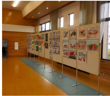
渡津小生徒さんの傑作