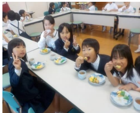
団子美味しかったね