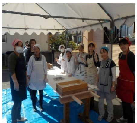
健全育成会のお餅美味しかった