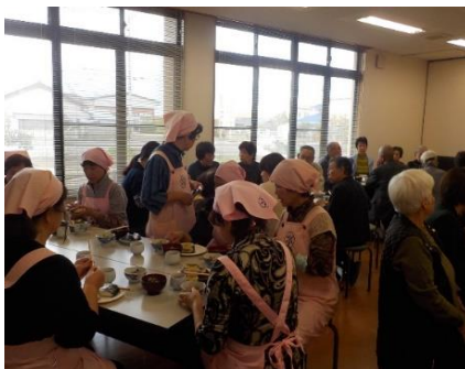
皆さんと美味しく頂きました