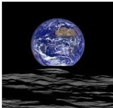
月から見た青い「地球の出」

10月5日(木)お月見の行事として、きな粉餅とみたらし団子を作りおいしく食べました。頂く前に、センター長さんから月と地球のお話を聞きました。月から地球を見た写真を見ながら、地球から月まで行くのに、歩く(4km/時)と11年、車(60km/時)だと268日、新幹線(のぞみ300km/時)だと53日、ジェット機(1000km/時)だと16日、ロケット(アポロ3.6万km/時)だと3日、光だと1秒、かかるなどのお話がありました。「ちょっと月旅行に行ってきます」と言える時代はもうすぐそこ?