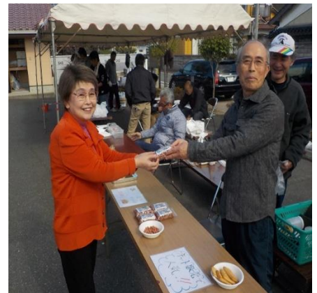
新規塩田産煎りピーナッツ完売