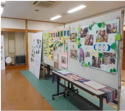
清和養護学校生徒さんの力作