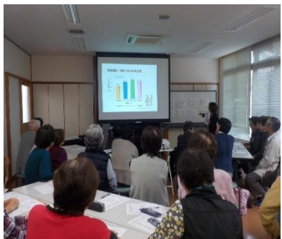
健康な食生活の話

10月24日(火) 渡津健康づくり推進会、慶老者教室、地区食生活改善推進協議会の共催で 健康教室がコミュニティ・センターで開催された。保健師さん、栄養士さんの健康な食生活 の話があり、血圧測定と健康相談の後、皆さんで食改さん手作りの健康食を頂きました。