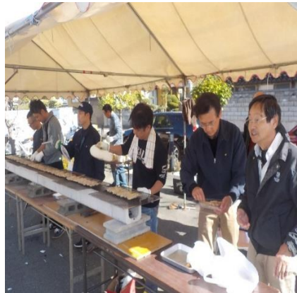
恒例の連合自治会焼き鳥完売