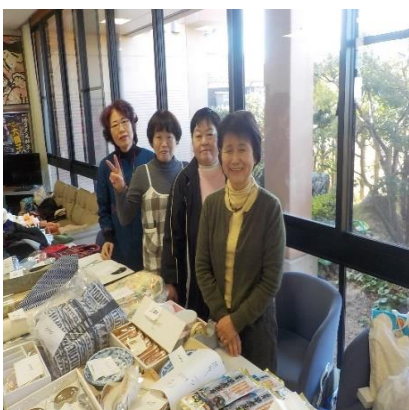
嘉戸婦人会のフリマ