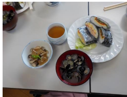
健康な食生活の一例 (おにぎらず)