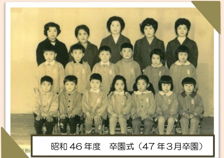
昭和46年度 卒園式 (47年3月卒園)