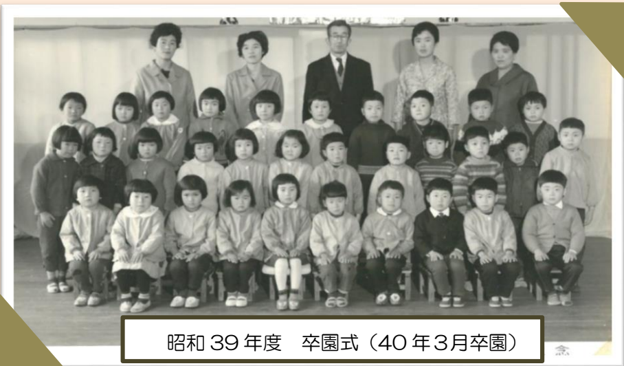
昭和39年度 卒園式 (40年3月卒園)