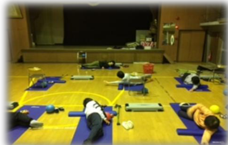
ロコモ教室