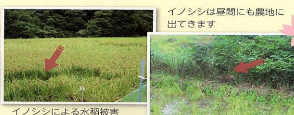
イノシシによる水稲被害

島根県の野生鳥獣による農作物被害額の うち、約80%がイノシシによるものです。 特に水稲への被害が大半を占めており、農 業にとってイノシシ対策は必須となっています。 田畑への侵入を防ぐためには、侵入防止 柵の設置が有効です。今回は、電気柵と広 域柵（ワイヤーメッシュ）について、設置 時のポイントなどをご紹介します。