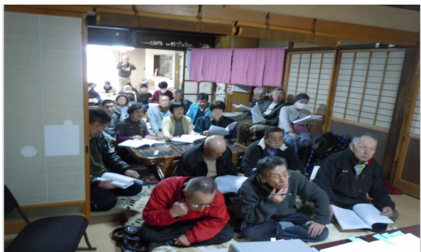
黒松の歴史を知る会の様子