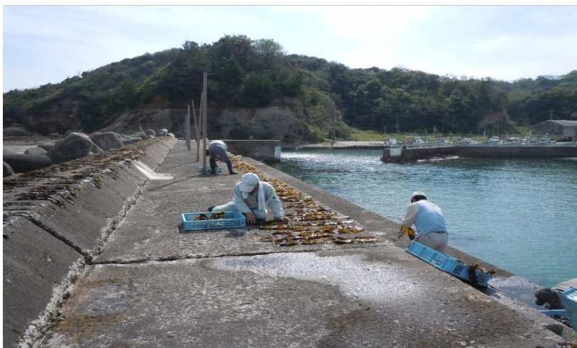
わかめ干しの様子