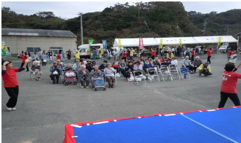
黒松港まつりの様子