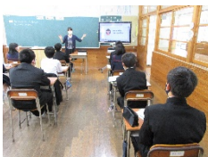
3年「学び合い・発表」