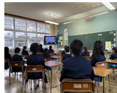
リモートの様子から

2学期の終業式と3学期の始業式をリモートで行ってみました。子どもたちは、各教室でモニターを通じて、私の話を聞きました。とくに、始業式の日には気温が終日氷点下で、寒さ対策としても有効な方法と考えました。GIGA（ギガ）スクール構想として、学校のネット環境もさらに整備され、子ども一人一人にPC（タブレット）が準備されます。当初は、5年計画で順次進めていく予定でしたが、このコロナ禍で、今年度中にはネット環境整備が完了となります。これによって、オンラインによる授業も小学校でも可能となります。学び方も少しずつ変わろうとしています。