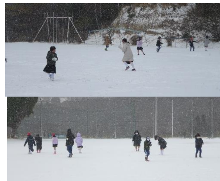
外遊びする様子から

3学期は、各学年のまとめの学期であると同時に、次年度に向けての準備の学期です。学校でも、良いまとめができるよう、指導・支援していきたいと思います。保護者・地域の皆様にも、引き続き学校の教育活動に際しまして、ご支援頂きますようよろしくお願いいたします。