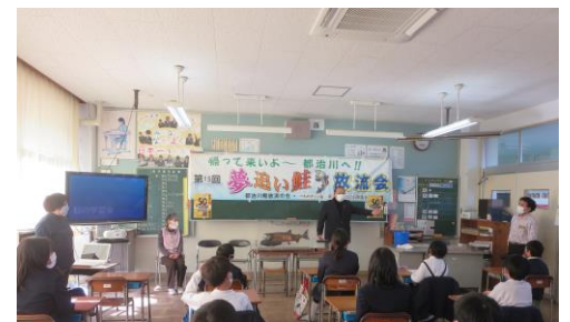
4年生の鮭の学習から

4年生は、自然環境をテーマにした学習を「総合的な学習」の時間に行っています。15日（金）には、都治川の鮭放流事業について、地元の「都治川鮭放流の会」の方に来校頂きお話を聞きました。鮭が遡上するきれいな川を復活させようと取り組んでおられる様子を聞くことにより、自然を大切に思い、ふるさとのよさに気づく時間となりました。