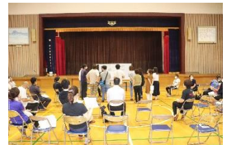
～懇談会の様子から～

今年の地区懇談会は、学校に全地区集まって頂き実施しました。学校から「夏休みの生活」についてお話をさせて頂いたあと、それぞれの地区(浅利, 都治・後地, 波積, 黒松)に分かれて危険箇所や、休み中のラジオ体操, 奉仕活動等について話し合っていました。休み中、子どもたちは家庭・地域での生活が中心になります。健康で安全な生活が送れますよう、ご配慮頂きますようよろしくお願い致します。