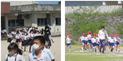
～避難訓練の様子から～

今年度最初の避難訓練を実施しました。近年、台風や豪雨等自然災害も多発しています。「想定外」という言葉もよく耳にしますが、いざという時に「命を守る行動」ができるように、学校では年間数回にわたって、訓練を実施しています。今回は、火災を想定した訓練を実施しました。非難の際の合い言葉「お・は・し・も」を確認するとともに、避難訓練の大切さについて話しました。