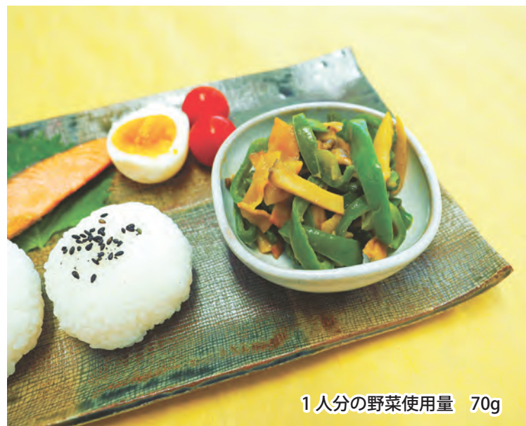
1人分の野菜使用量 70g