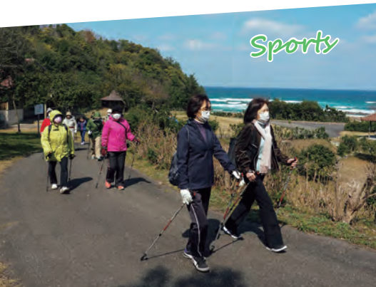
↑3月15日に開催されたノルディックウォーキング体験会の様子

海水浴、マリンスポーツ、スポーツ、キャンプ、アミューズメント、万葉ゾーン、石見の自然を生かした遊びが盛りだくさん!