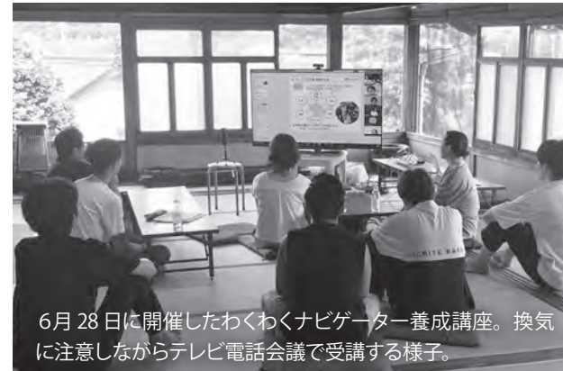
6月28日に開催したわくわくナビゲーター養成講座。換気に注意しながらテレビ電話会議で受講の様子。