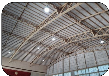
照明が全てLEDに交換