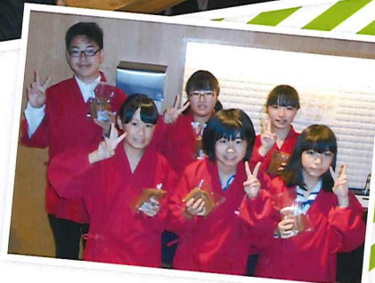
3年『バイキング給食』