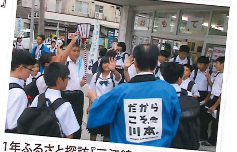
1年ふるさと探訪『三江線』