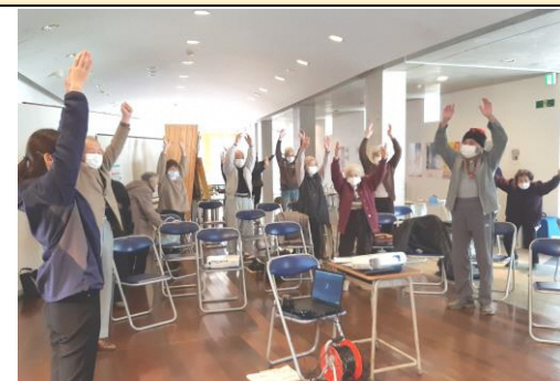
ラジオ体操や軽いストレッチ