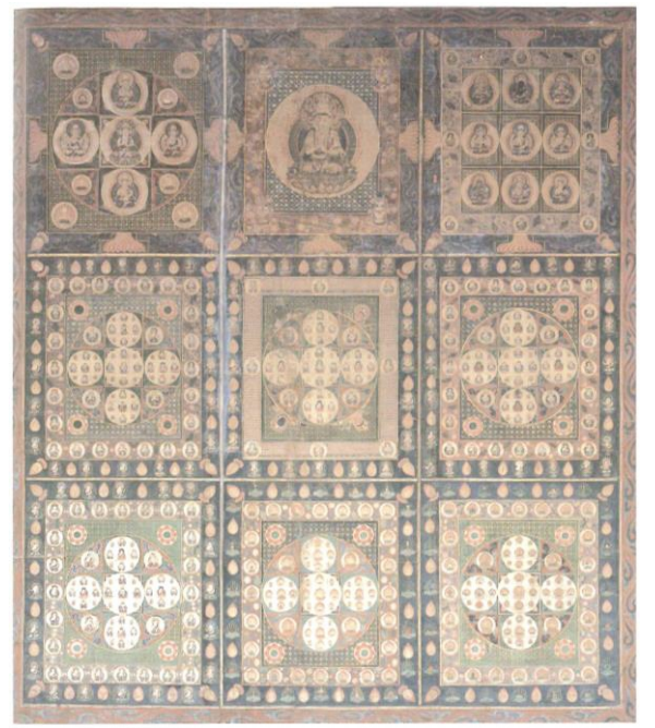
島根県指定文化財 「両界曼荼羅図」(金剛界) 迎接寺