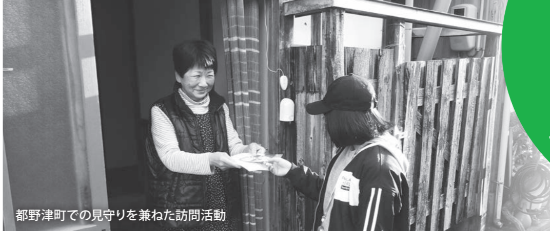
都野津町での見守りを兼ねた訪問活動