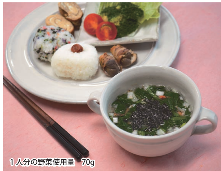
1人分の野菜使用量 70g