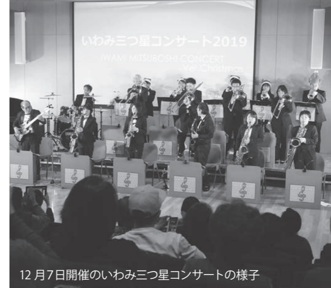
12月7日開催のいわみ三つ星コンサートの様子