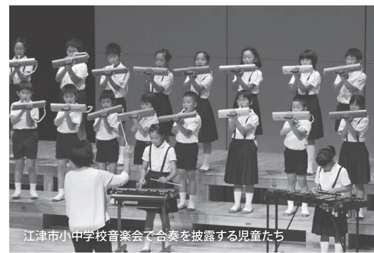
江津市小中学校音楽会で合奏を披露する児童たち