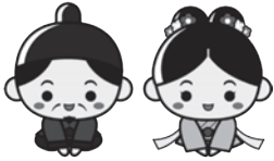
江津市 PR キャラクター 「人麻呂くんとよさみ姫」