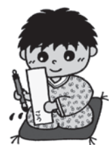
江津市健康づくりキャラクター「ごうくん」