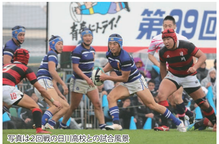
写真は2回戦の日川高校との試合風景

29回連続出場となった石見智翠館は1回戦で富山第一に132-0で快勝。続く2回戦でも日川に27-0で勝利しました。1月1日、3回戦の京都成章では15-24と惜しくも敗れましたが、後半の開始直後には逆転する場面もあり、粘り強いプレーを見せました。`ワンチーム、で勝利を目指す選手たちの姿は、元日から私たちの心に勇気と感動をもたらしてくれました。