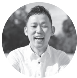
江津市教育の魅力化プロデューサー