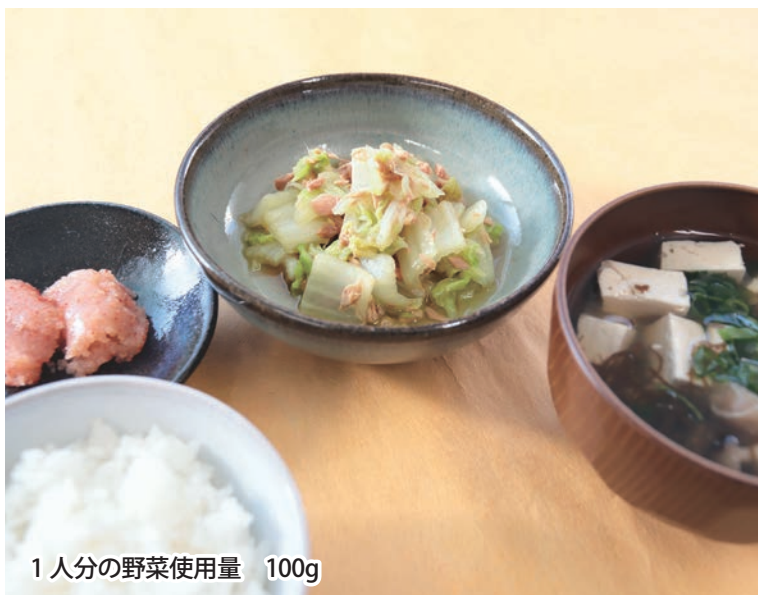
1人分の野菜使用量 100g