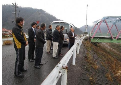
桜江大橋の川戸よりの堤防から、一昨年水位を見聞!