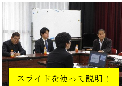
スライドを使って説明!