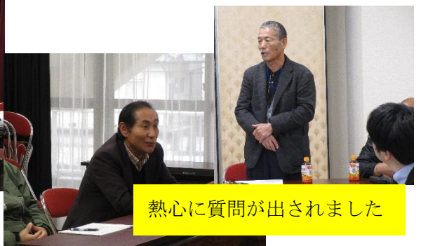
熱心に質問が出されました