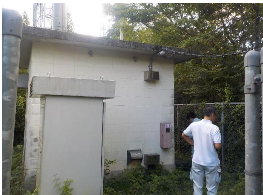
【現地踏査（島の星・平野山中継局）】

住民に対し、効率的かつ速やかな情報伝達・周知を行うことができる最適なシステムを検討、実施するために行うデジタル防災行政無線（同報系）整備事業の工事発注に必要な実施設計を行うことができた