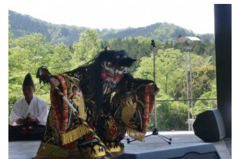
※長谷デーの写真は昨年のものです

< バザー > 炊き込みご飯・うどん・焼き鳥・かき氷・ジュース たくさんの方のご来場お待ちしております。