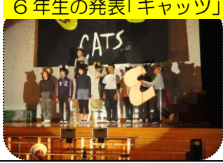
6年生の発表「キャッツ」

小雨の降る肌寒い11月26日、桜江小学校の 学習発表会が屋内運動場で行われ、全校児童 103人の発表がありました。 学年別の発表で、低学年は可愛 らしく、高学年はそれなりにし っかりした発表をして、参加し た桜江地域の人の拍手と声援 を浴びていました。小学校の行 事として、運動会に並ぶ良い行事でした。