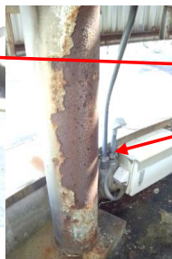
（風の国モニュメント撤去と錆防止処理※腐食）