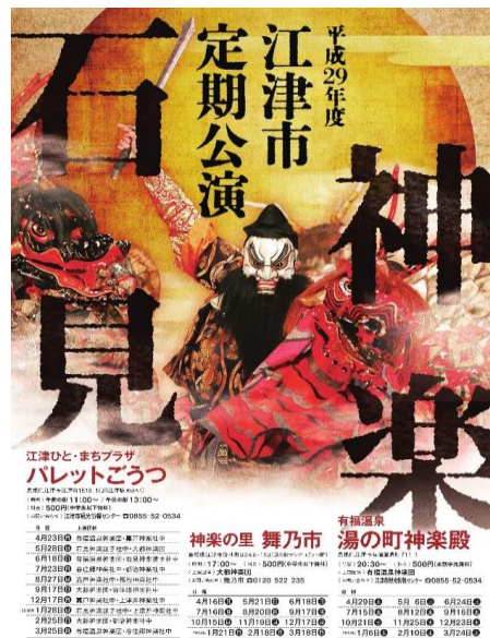
(江津市石見神楽定期公演ポスター)