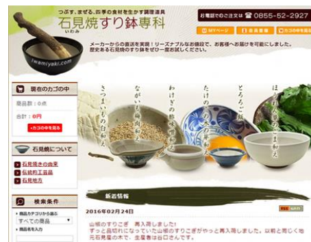
【販路開拓事業】 事業者：株式会社元重製陶所 ・オンラインショップのリニューアル