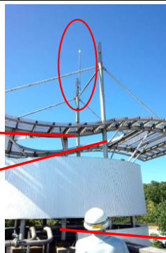
←避雷針とダミー柱を残す