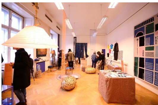
【販路開拓事業】 事業者：合同会社Design Office Sukimono ・海外販路開拓のための商談会出展