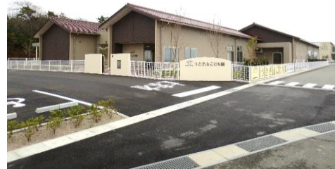
うさぎ山こども園 (新築)