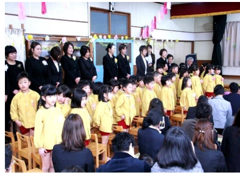
和木保育所（平成30年3月31日閉所）