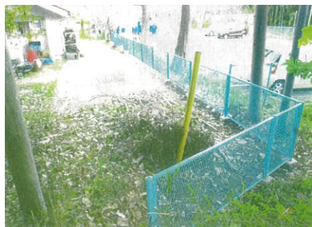
さくらこども園 (フェンス改修)