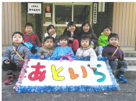
跡市保育所（平成30年3月31日閉所）