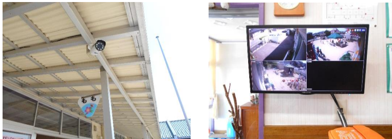
のぞみ保育園 (防犯カメラ)