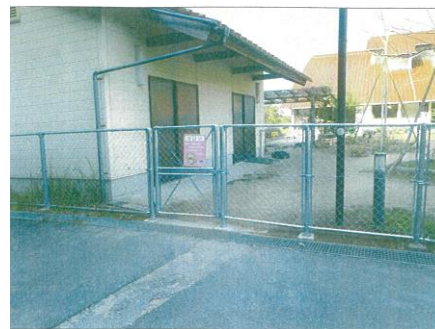
あさりこども園 (フェンス等改修)