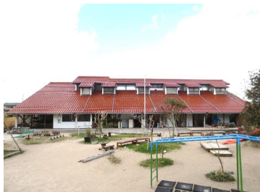
あさりこども園 (沐浴室移設)