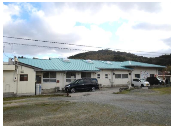
敬川保育所 (屋根替え)