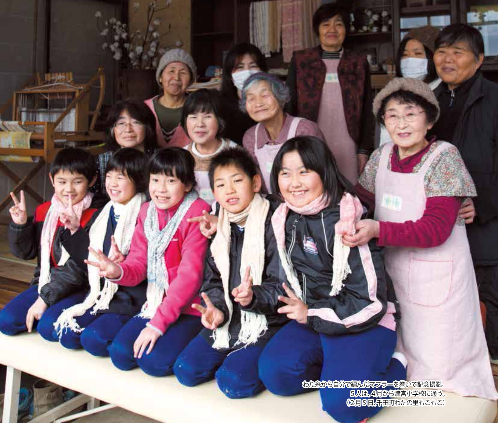
わた糸から自分で編んだマフラーを巻いて記念撮影。 5人は、4月から津宮小学校に通う。 (2月5日、千田町わたの里もこもこ)