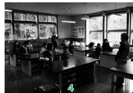
1. 楸さんは、家族全員の名前を入れたカップを作っています。 2. 三瀧さんは置き物を作り挑戦。お母さんも一生懸命作っています。 3. 「できた」。自分で作った作品は誇らしいもの。 4. 親子陶芸教室も全校で一度にできます。