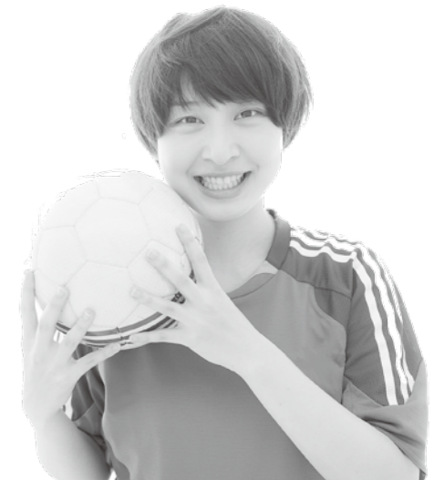
ボールと心のサイン、ともに大切なのはつなぐことです。

今、自死する人が全国で何人いるか知っていますか。 平成26年中に2万5427人(全国)が自死しています。これは平成26年中に交通事故で亡くなった人数4113人の約6倍に相当します。 一人でも多くの命を守るために、今私たちに何ができるか考えましょう。「気づき」「傾聴」「つなぎ」「見守り」。このような支援を必要としている人が近くにもいるかもしれません。 このうち「つなぎ」は相談先や専門家などを紹介し、相談や受診につなげることです。 「傾聴」することでいろいろな悩みを聞くかもしれません。その中で適切な場所へつなぎ、温かく見守っていくことが大切になります。