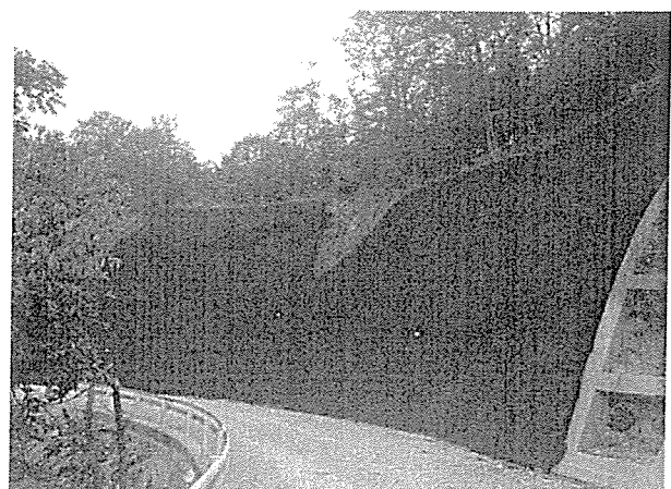
平成25年度（25年災）林道長谷線災害復旧工事