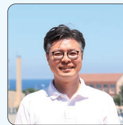
地域活性化起業者

江津で熱い思いを持った人、活動している人に出会うことができ、すごく充実しています。江津の自然と、出会った人に支えられて、ここでしかできない体験ができていたので、帰ってきて本当に良かったです。江津のみなさん、ありがとうございます！