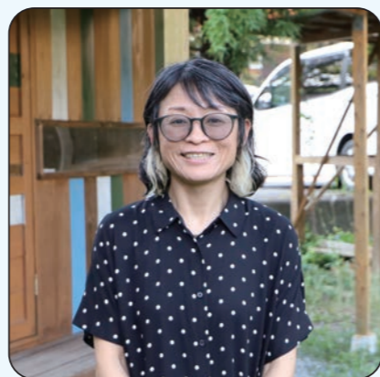
地域おこし協力隊