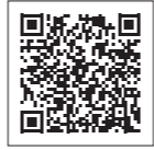
▲島根県パスポートセンター