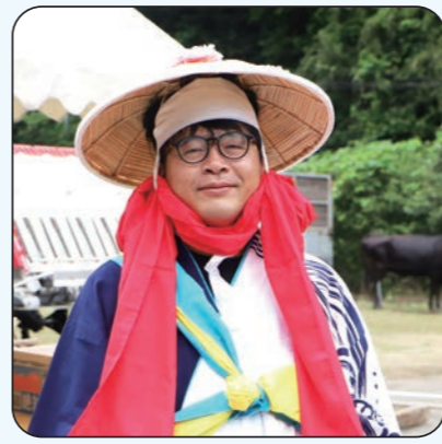
地域活性化起業人 【着任先：農林水産課】

これまで多くの地方博覧会や、国際博覧会などの大規模プロジェクトに関わってきました。これからの第二の人生は、江津と大阪を拠点に、互いの懸け橋になるようなプロジェクトを作り上げていきたいです！