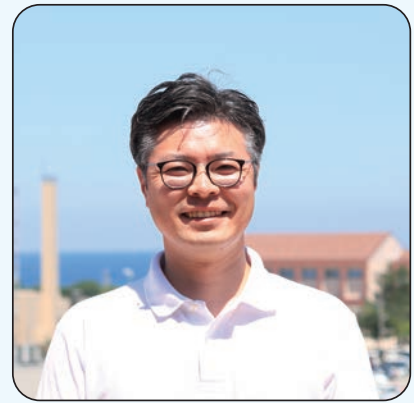
地域活性化起業人 【着任先：政策企画課】

江津で熱い思いを持った人、活動している人に出会うことができ、すごく充実しています。江津の自然と、出会った人に支えられて、ここでしかできない体験ができていたので、帰ってきて本当に良かったです。江津のみなさん、ありがとうございます！