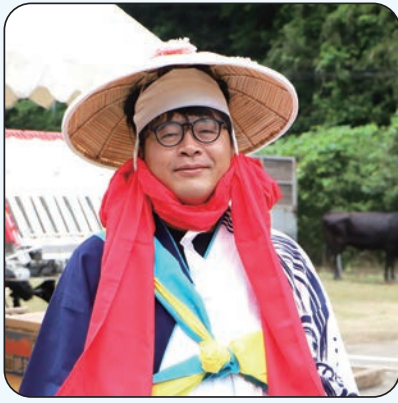
地域活性化起業人 【着任先：農林水産課】

江津市には現在、地域活性化起業人4人、地域おこし協力隊2人が着任し、それぞれのミッションに取り組んでいます。期待されるのは、移住者ならでの熱意と視点によって、新しい風を呼び込むこと。今月号では、そんな6人に注目し、業務の内容や、その人柄を紹介します。