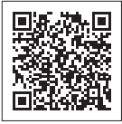
▲島根県 パスポートセンター