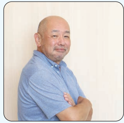
地域活性化起業人 【着任先：政策企画課】

放置竹林を伐採して、メンマに加工して販売する取り組みをしています。いまは旭町や金城町が中心ですが、江津でもこの取り組みに協力していただける方を募集しています。ぜひ、みんなで竹を食べましょう！