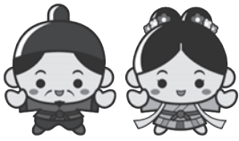
江津市PRキャラクター 「人麻呂くんとよさみ姫」