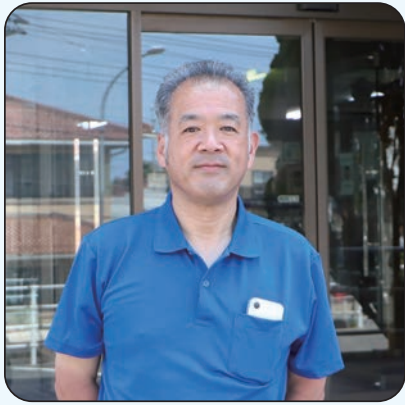
地域活性化起業人 【着任先：江津商工会議所】