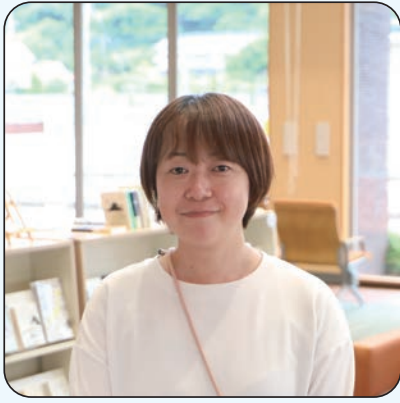
地域おこし協力隊 【着任先：NPO 法人てごねっと石見】