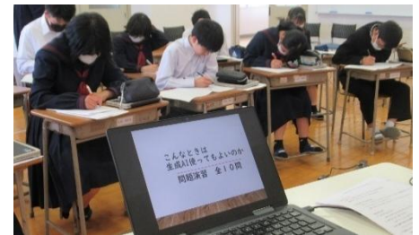
生成 AI 使い方講座

今後も、子どもたちが安全かつ有効に ICT を活用し、自らの力で未来を切り拓いていけるよう支えてまいります。ご家庭のご理解とご協力をお願いいたします。