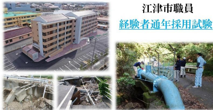
江津市職員 経験者通年採用試験

〔試験日〕 第一次試験 ▶▶ 令和 8 年 6 月 21 日(日) 第二次試験 ▶▶ 令和 8 年 7 月 12 日(日)