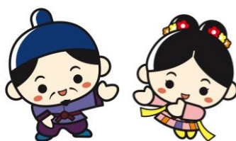
江津市PRキャラクター 人麻呂くん♡よさみ姫