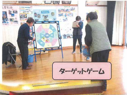
ターゲットゲーム