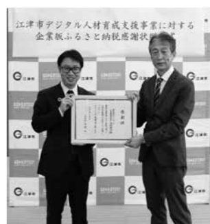
▲サードウェーブ株式会社

謝状贈呈式を開催しました。同金庫は、創業100周年を迎えた地域密着型の金融機関として、江津市内へ2つの支店を設置され、江津市ビジネスプランコンテストをはじめとする、本市での地域活性化の取組みの一助を担っていただいています。 このたびは、江津市まち・ひと・しごと創生推進計画に掲げる「住みたい！自分を活かせる場所を創出する事業」に対してご寄附いただいたものです。