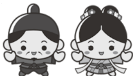
江津市 PR キャラクター 「人麻呂くんとよさみ姫」