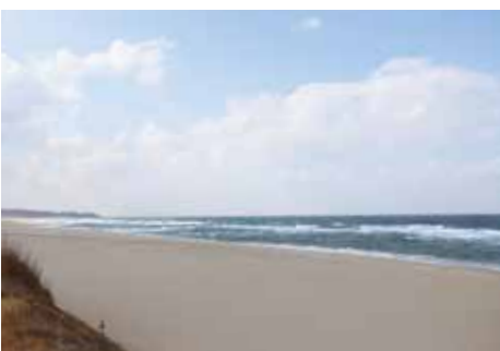
▲波子海水浴場（令和6年1月撮影）

卒業を迎える学生さんも、JRやバスを利用し、綺麗な石見の景色を見ながらアクアスに来館し、思い出作りをしてみたいかがでしょうか。