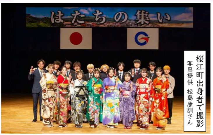
桜江町出身者で撮影