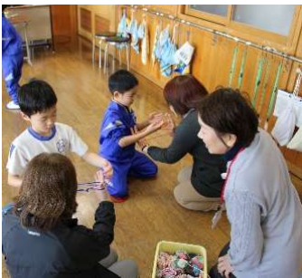
昔遊びの会(1年生) 講師:桜江町民生委員の皆様