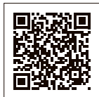
▲振替納税はこちら

◎ 期間 2月16日(金)～3月15日(金) ※土日祝日を除く。 ◎ 受付時間 午前8時30分～午後4時