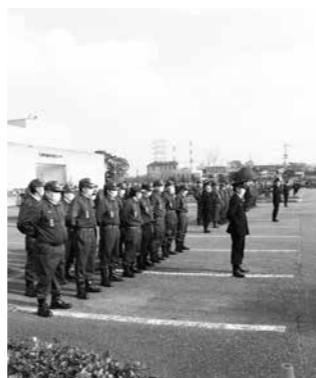
▲令和5年出初式の様子