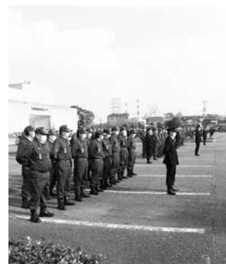
▲令和5年出初式の様子

◎日時、場所 ・1月7日(日) 午前10時30分～ 江の川左岸堤防(江津町) ・1月7日(日) 午前10時45分～ 菰沢池(浅利町)、八戸川鮎観橋 付近河川敷(桜江町市山)