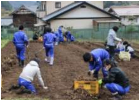
6年生 里芋ほり体験