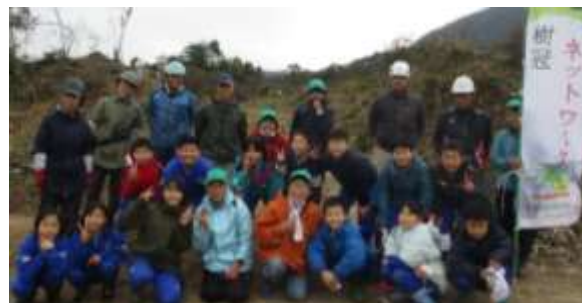
4年生 森林学習・植林