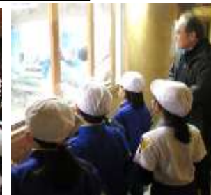
2年生 市山たんけん