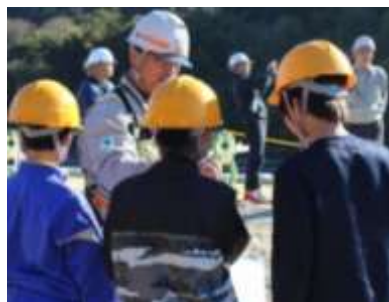
5・6年生 今井産業現場見学