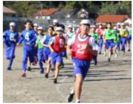
全校 マラソン記録会