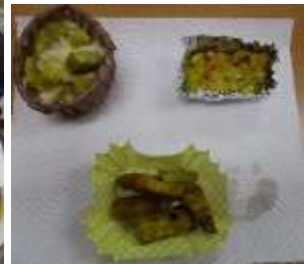
1・2年生 さつまいものおかし作り