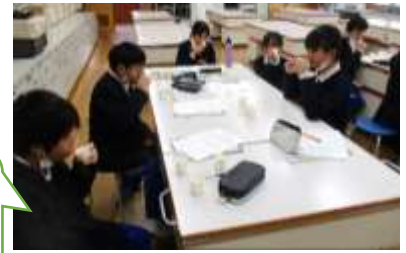
5年生 だし だし の学習