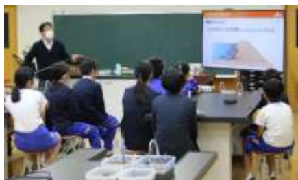
6年生 今井産業出前授業