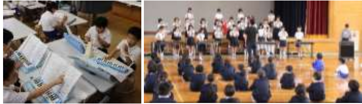
音楽会練習・校内発表・江津市音楽会～4・5年