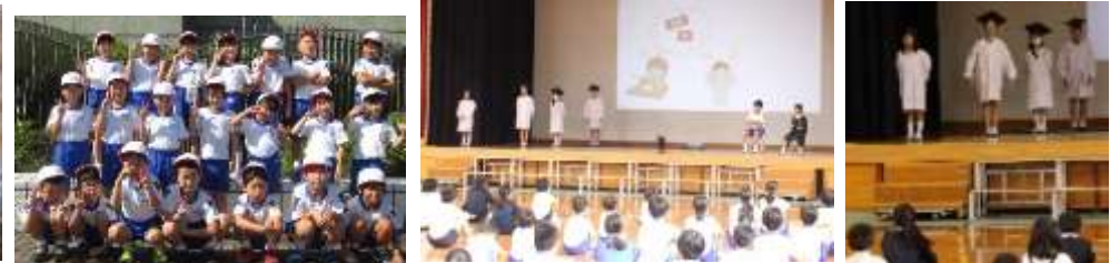
保健委員会発表(全校集会)