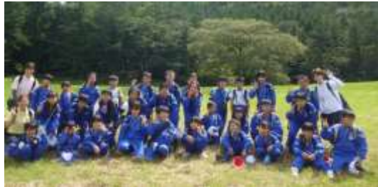
遠足(サヒメル)～3・4年