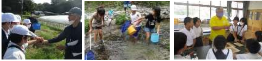
生産者さんとの交流、川遊び・森林学習～4年生