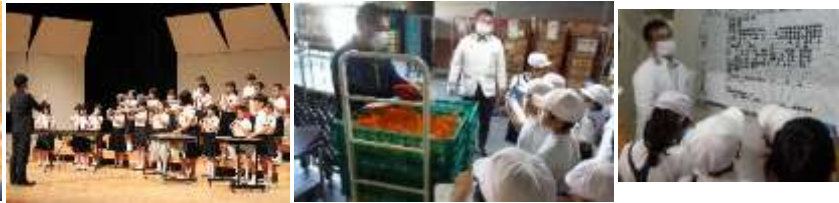
ゆめタウン見学～3年