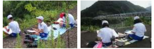
スケッチ会「川戸駅周辺」～5・6年