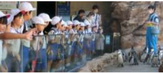
遠足(アクアス)～1・2年