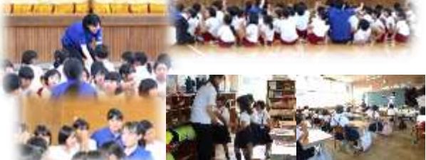
活動の時だけでなく、各クラスに学生が分かれて入り、学習の時間や休み時間も一緒に過ごしました。

フィナーレは、学生たちが、「にじいろ」を子ども達に語り掛けるように歌い、涙する姿もありました。子どもにとっても学生にとってもかけがえのない素敵な体験となったことと思います。この「生きた体験」は、きっとこの先も心の中に残ってくれるものと思います。