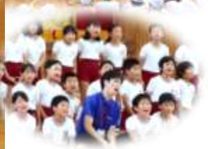
高学年 発表の後みんなで集まってはじける笑顔。