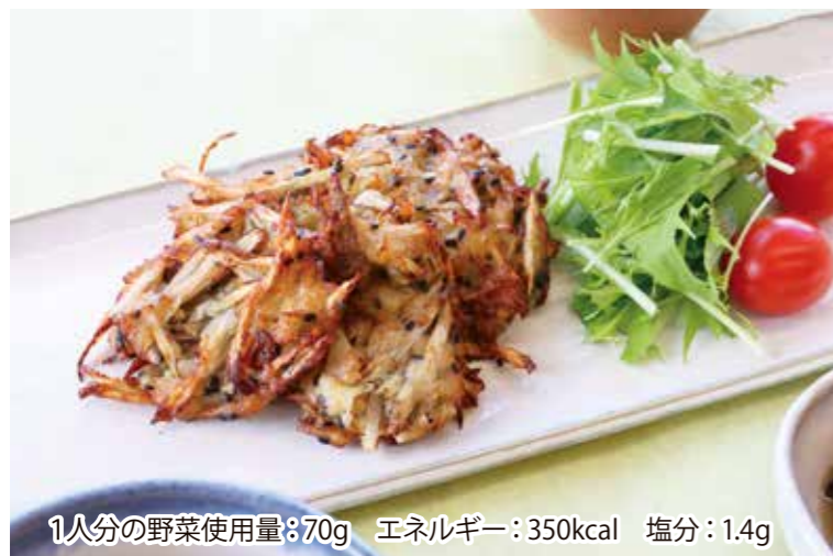
1人分の野菜使用量:70g エネルギー:350kcal 塩分:1.4g