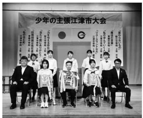
↑少年の主張江津市大会で発表した生徒たち