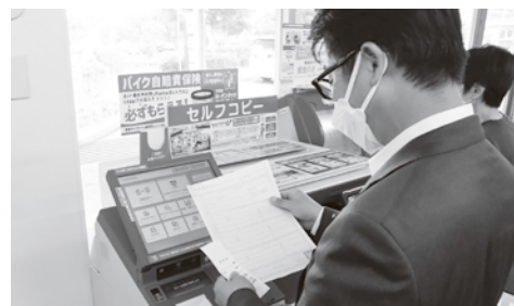
▲7月5日、マイナンバーカードを利用した各種証明書のコンビニ交付が始まりました。