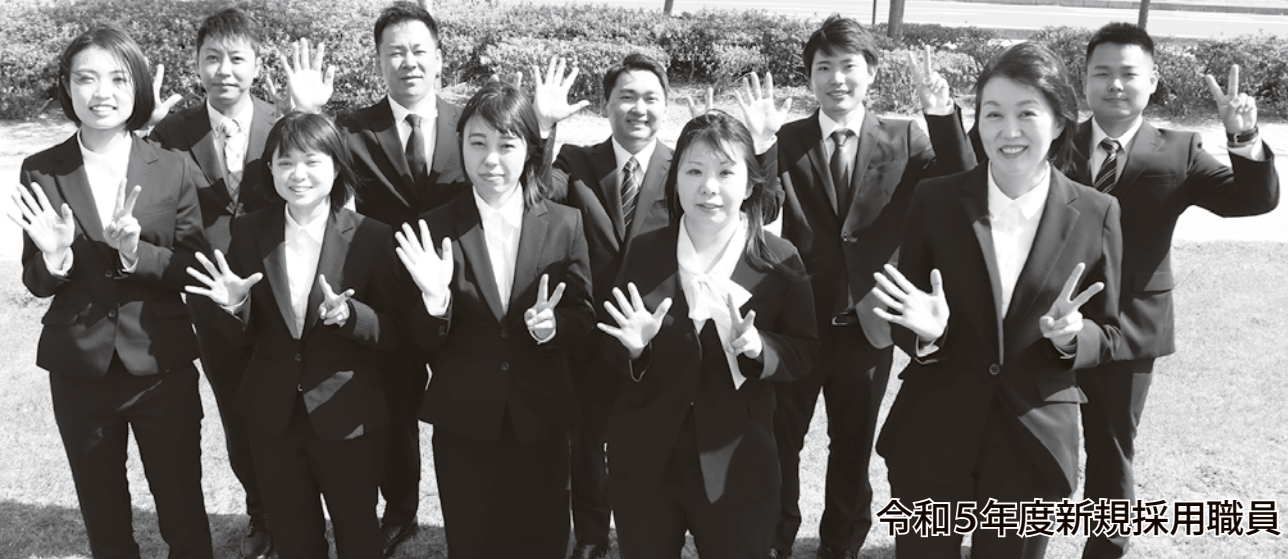
令和5年度新規採用職員