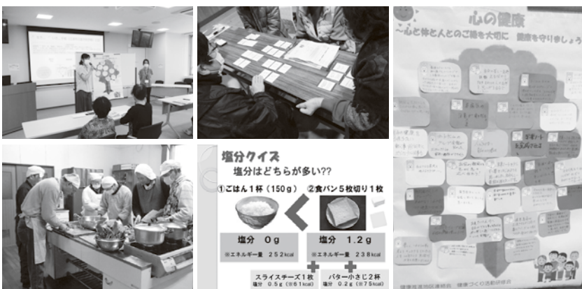
▲健康づくり推進会が行う「健康づくり活動」の様子