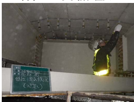
写真 4-4 ひび割れ注入工

コンクリートのひび割れにエポキシ樹脂系、ポリマーセメント系の材料を注入し、ひび割れの充填と構造物の一体化を図り、コンクリートの耐久性及び防水性の向上を図る工法。