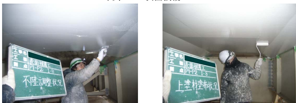
写真 4-5 表面被覆工

コンクリート表面に、コンクリートの劣化や鋼材腐食の原因となる劣化因子（塩分、二酸化炭素、水分など）の進入を抑制または防止するため、エポキシ樹脂系の塗布剤などにより被覆を形成する工法。