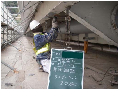
写真 4-1 塗装塗替工

錆の発生箇所をケレン（素地調整）し補修塗装を行い、鋼材の腐食を防止する工法。鋼材が著しく腐食しており、ケレン時に鋼材の破断、減厚などが認められた場合、当て板補強工により補修を行うこともある。