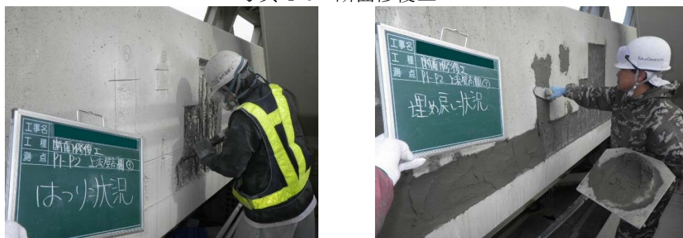
写真 4-3 断面修復工

コンクリートの劣化、鋼材の腐食等によって欠損したコンクリート断面を、ポリマーセメントモルタルなどによって、左官により当初の状態に戻す工法。小規模な補修に適しており、大規模な場合は吹付工法などを採用することもある。