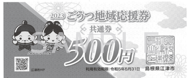
▲ごうつ地域応援券 共通券（実際の券は緑色です）