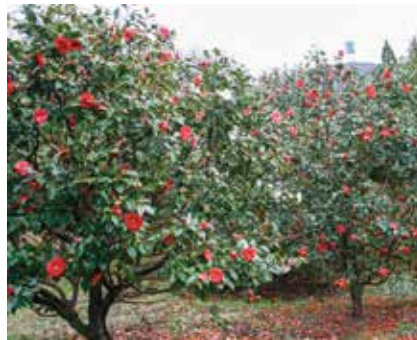
③ 椿の里のツバキ (島の星町) 見頃：12月頃～5月頃