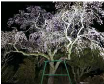
⑤ 山本の白枝垂桜・川平ふれあい 広場前の芝桜 (川平町) 見頃：桜4月上旬・芝桜4月中旬～5月