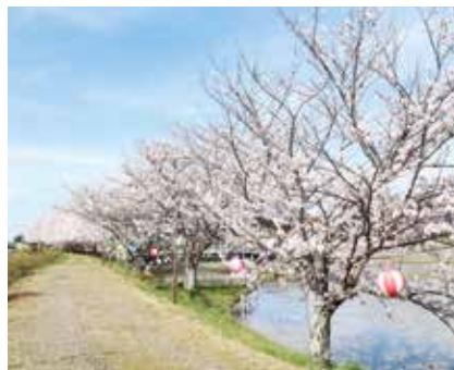
⑥ 敬川堤防沿いの桜並木 (敬川町) 見頃：3月下旬～4月上旬