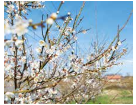
① 江津東小学校付近の梅 (後地町) 見頃：2月上旬～3月中旬