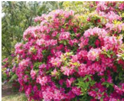
② 丸子山公園の桜・ツツジ (江津町) 見頃：桜3月下旬～4月上旬 ツツジ4月下旬～5月上旬