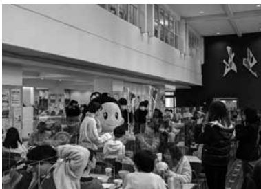
▲「チームカルマンド」 江津の特産グルメを紹介しました。