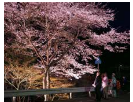
⑧ 有福温泉の桜 (有福温泉町) 見頃：3月下旬～4月上旬