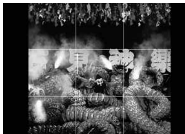
▲「チーム海老原」 SNSで「石見神楽」を紹介しました。