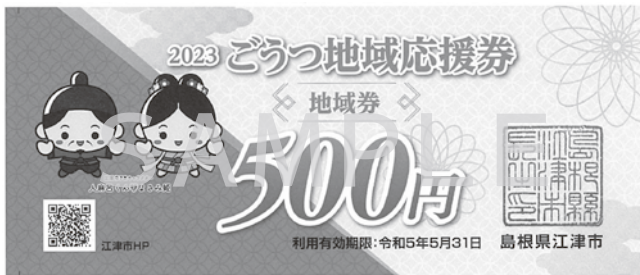
▲ごうつ地域応援券 地域券（実際の券はオレンジ色です）