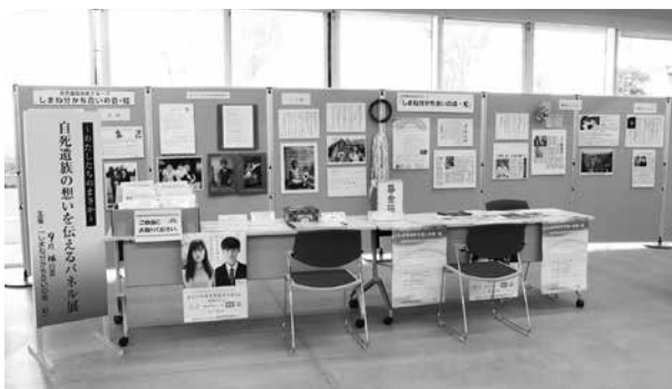
▲昨年9月に開催した「自死遺族の想いを伝えるパネル展」の様子