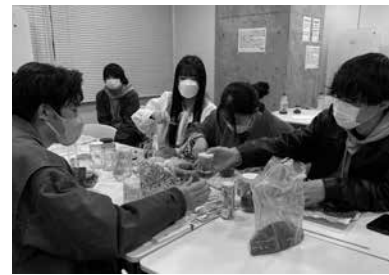
▲「チーム江津革命 2022」 「苔」と「風の国」を紹介しました。