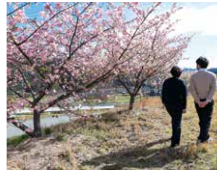
④ 国道261号沿いの河津桜(松川町) 見頃：2月下旬～3月上旬