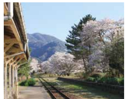
⑨ 旧川戸駅周辺の桜 (桜江町) 見頃：3月下旬～4月上旬