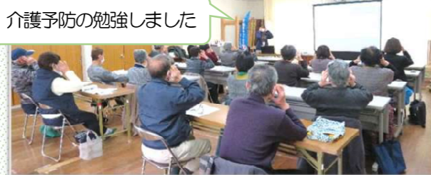
介護予防の勉強しました