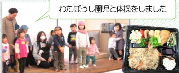
わたぼうし園児と体操をしました