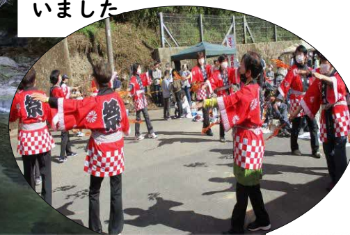
昭和10年から踊り継がれている千丈溪音頭

360名みんなで盛り上げ楽し んだイベントでした。ご協力いた だいたみなさんありがとうございます