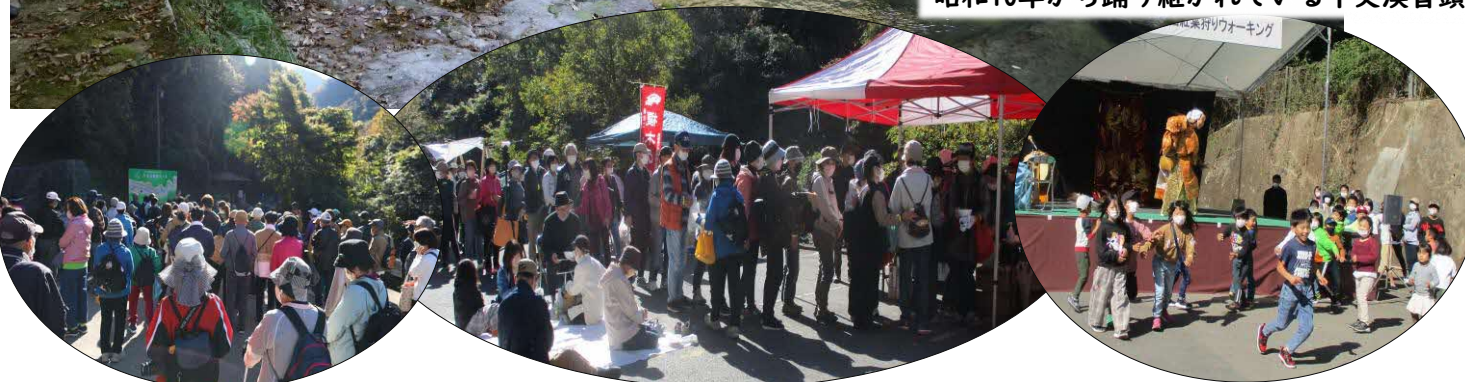
ウォーキング出発!