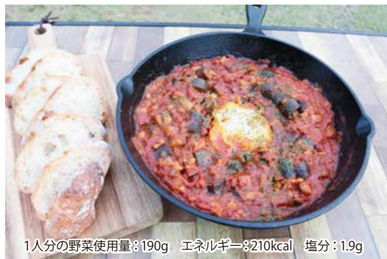
1人分の野菜使用量:190g エネルギー:210kcal 塩分:1.9g