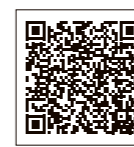
▲島根県ホームページ

市民の皆さんは、県や市から提供する情報に基づき、冷静な対応をお願いします。判断に困るような場合には、保健所または市の相談窓口にお問い合わせください。