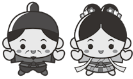
江津市 PR キャラクター 「人麻呂くんとよさみ姫」