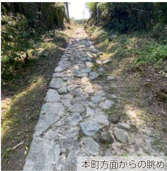
本町方面からの眺め

5月16日、江津市教育委員会定例会で議決され、「山陰道（土床坂）」が江津市指定文化財となりました。この指定は、前回の平成7年2月10日指定の大倉のムクノキ（桜江町谷住郷）以来、27年ぶりの指定となります。 山陰道（土床坂）は江津町に位置する市道嘉久志土床線の一部区間で、山辺神社所蔵の『往還筋御普請出来形帳』によると、天保6（1835）～1836年（に整備されています。長さ105m、幅1・8mの石畳道で、現在もおおむね往時の景観が保たれています。