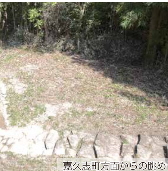
嘉久志町方面からの眺め

5月16日、江津市教育委員会定例会で議決され、「山陰道（土床坂）」が江津市指定文化財となりました。この指定は、前回の平成7年2月10日指定の大倉のムクノキ（桜江町谷住郷）以来、27年ぶりの指定となります。 山陰道（土床坂）は江津町に位置する市道嘉久志土床線の一部区間で、山辺神社所蔵の『往還筋御普請出来形帳』によると、天保6（1835）～1836年（に整備されています。長さ105m、幅1・8mの石畳道で、現在もおおむね往時の景観が保たれています。